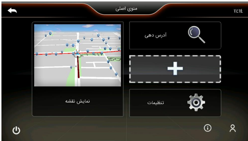
منو اصلی نرم افزار رهیاب ای نو

توجه: جهت اطلاع از شماره سریال منحصر به فرد نقشه رهیاب می بایست آیکون "اطلاعات سیستم" واقع در صفحه اصلی نرم افزار را لمس نمود.