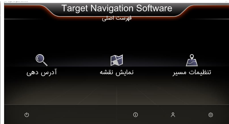
منو اصلی نرم افزار رهیاب تارگت